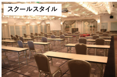
スクールスタイル